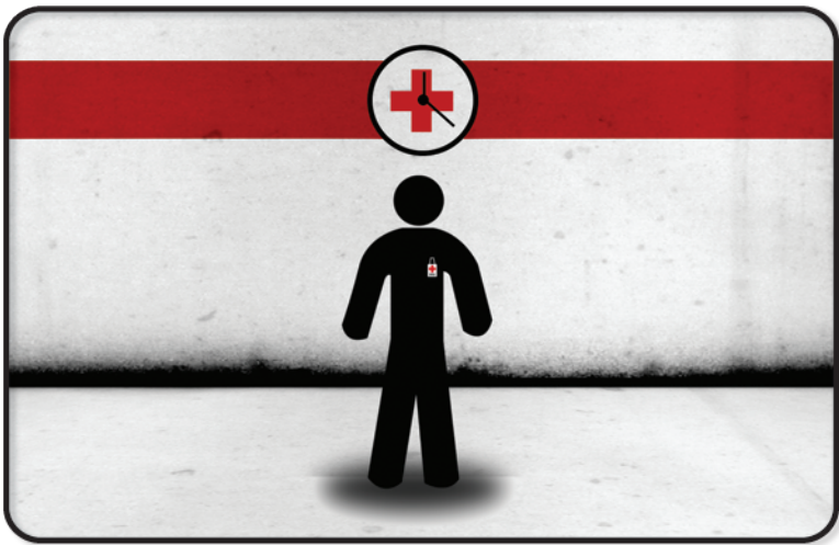
Sound Effect omino: “Drin Magico”.

Subito dopo appare un omino con un cartellino sul petto.