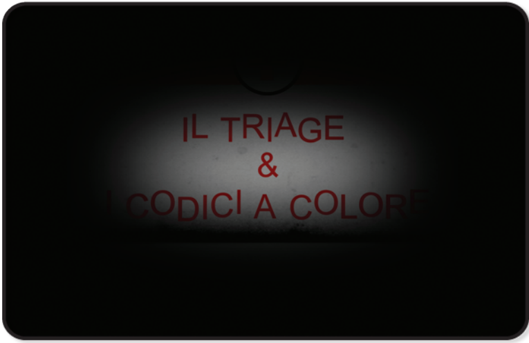
Assolvenza dal nero effetto bruciatura.

Inizia ad aprirsi un varco di forma circolare.